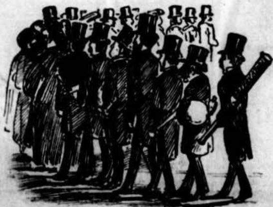
Pero s' ha nomenat una Comissió para aclarir l' assumpto.