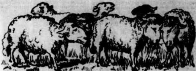
Que té à molts creyents alarmats.