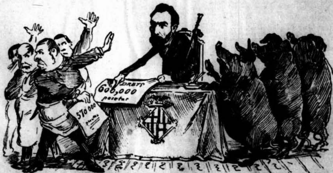
Porchs. — ¡Sr. Coll, mantinguis fort à las 600.000 pesetas, y 'ns salvarà la vida! Tocinayres. — ¡Sr. Coll, 600.000 no pot ser; y pensi que si salva als uns, será à costa del benestar dels altres!