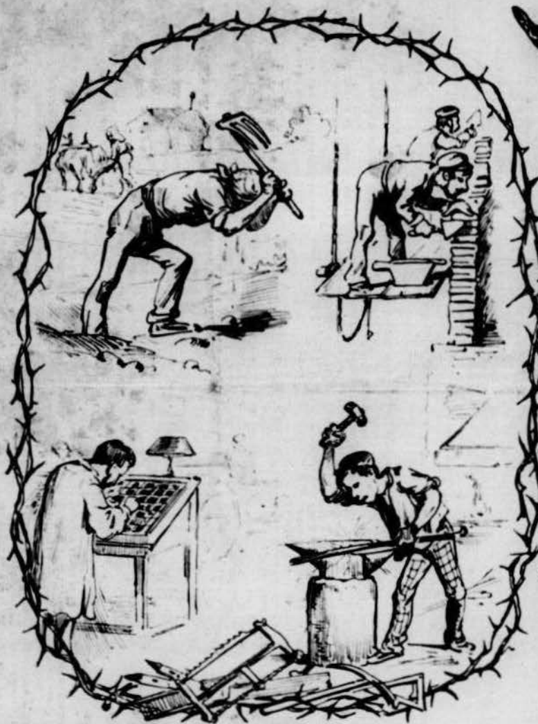
Qui ls fabrican