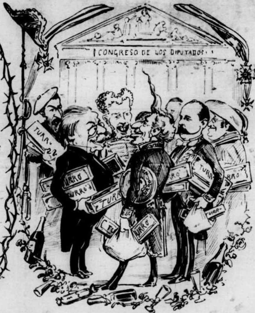
Y qui se ls menjan