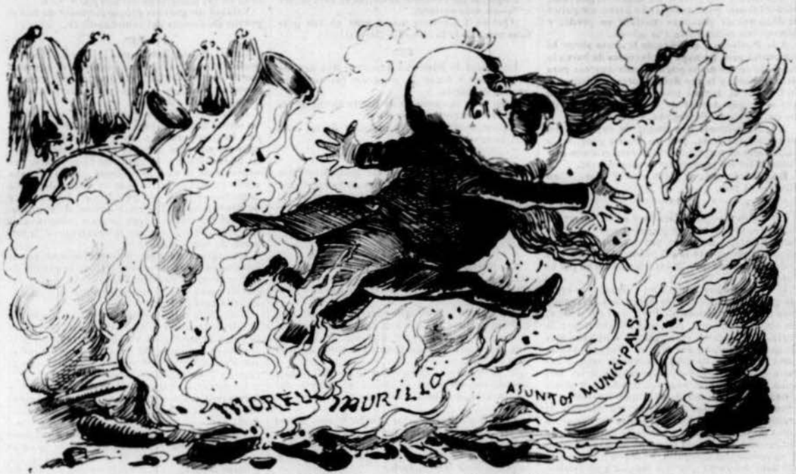
En Paco saltant los fochs ab música nova