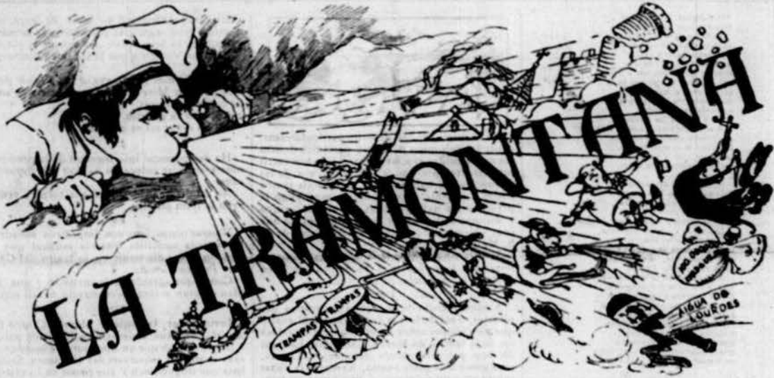
PERIÒDICH POLITICH VERMELL.

■ SALUT PÚBLICA ■ INTERESSOS POPULARS ■ ARTS Y LLETRAS ■