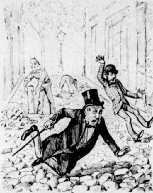
La de trencarse la nou del coll.