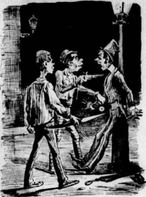
La de quedar-se sense lo que es seu.