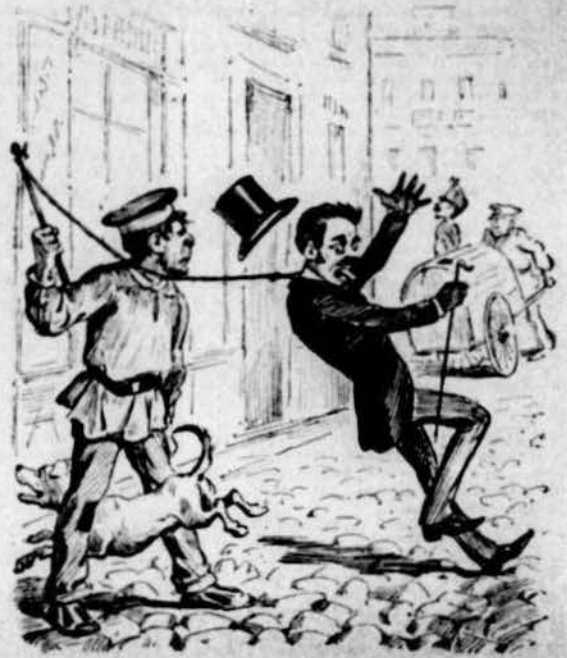
La de ser agafat pel llas dels gossos.