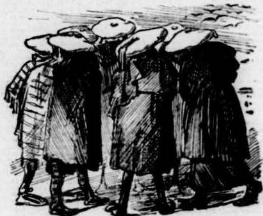
La professó va per dins quan se reuneixen carlins.