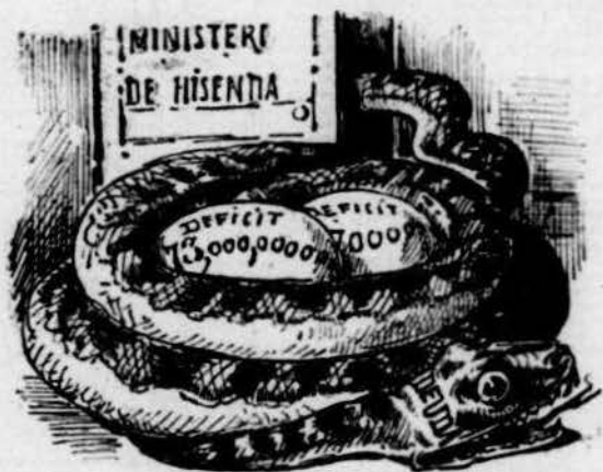
Los deutes son serp que creix y que ja 'n tenim un feix.