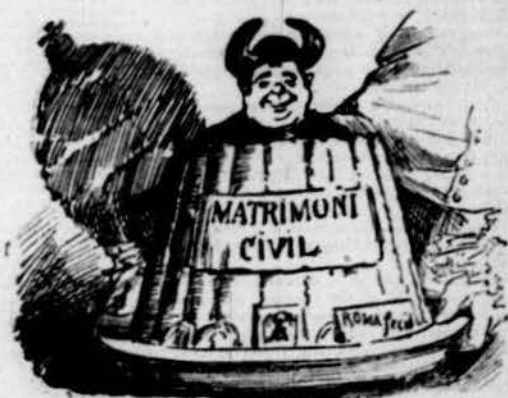
Fan un pastel que 'n val mil del matrimoni civil.