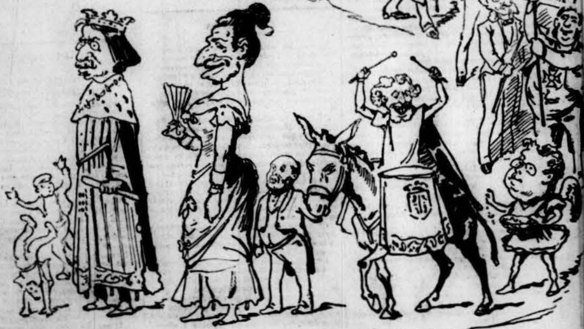
La que va per fora.