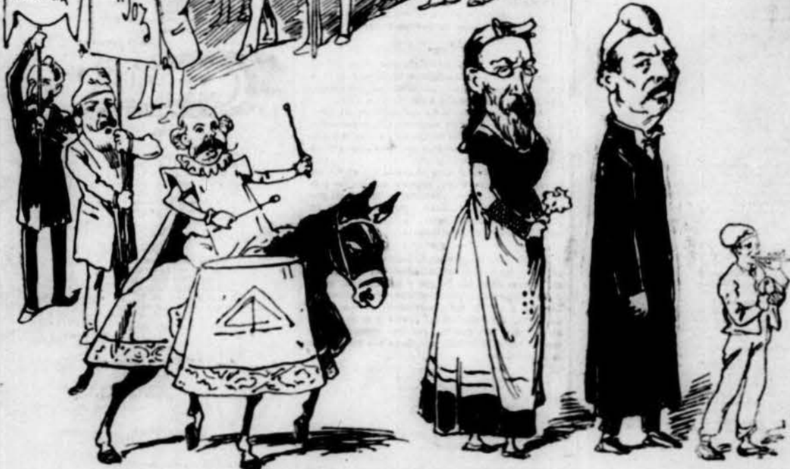
La que va per dintre.