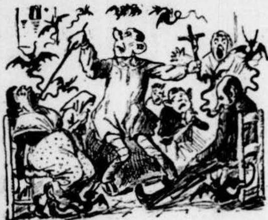
Ab santeristos y oracions los treu de tots los recons.