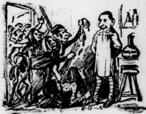
Una colla d' animals s' hi curavan tots los mals.