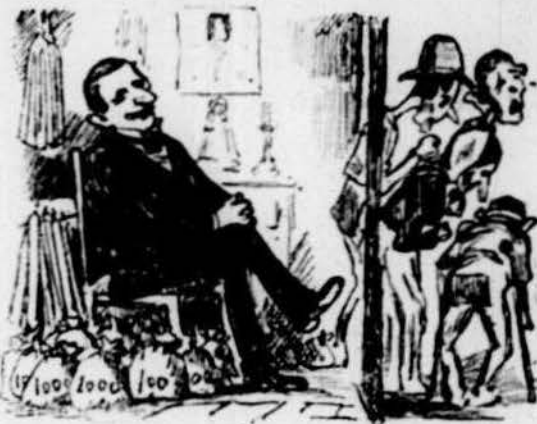
Y s' pensava ben aviat fershi tot un potentat.