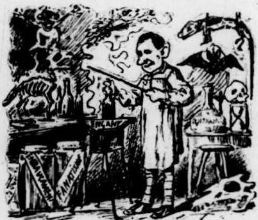
Un mano de Sant Martí los treva ab un nas molt fi.