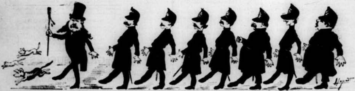
¡Doble derecha; paso redoblado!... ¡¡¡¡¡ Arrrs!!!!!!

— Basta por hoy y... en route! Se levanta la sesión.