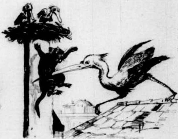
Y en aras del carinyo paternal clavat moria 'l hadre al mateix pal.

Aixó vol dir, lector, sens ferhi ambuts, que may vulguis que 't toquin los menuts.