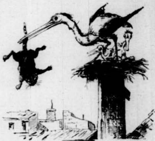
Y era tant lo que feu per conquerirlo que 'l pare dels menuts va castigarlo.