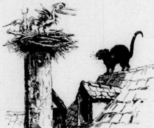
Un gatot que 's pensava ser molt viu d' aucellarros estranys va veure un niu.