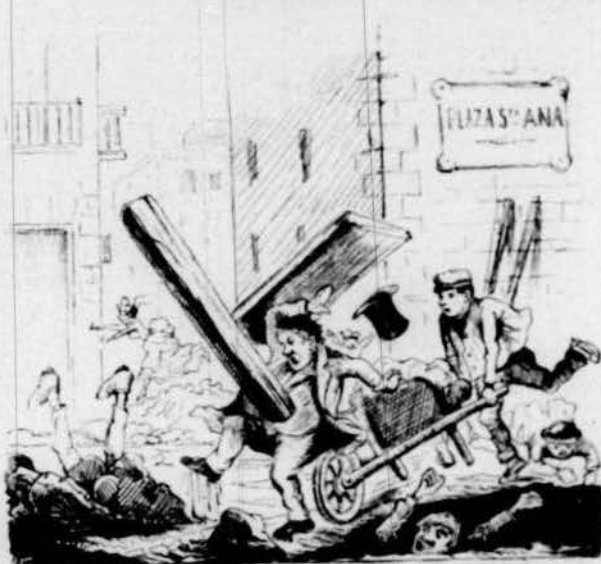
De Sant Ana en la molt famosa plassa s' exposa en gran manera aquell que hi passa