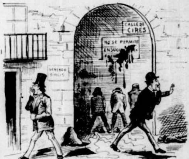
Y en certs carrers d' antiga nombradia s' hi exposa natural perfumeria