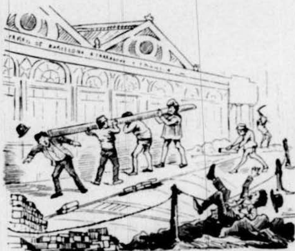
Ab l' entarugament que tant nos raca hi exposém la persona y la butxaca