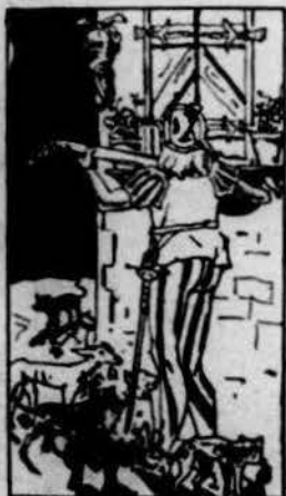
Ab l'escándol que fa, se remouben los animals del barri.