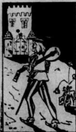
Va à ter una serenata à la filla del baró d'Espinach.