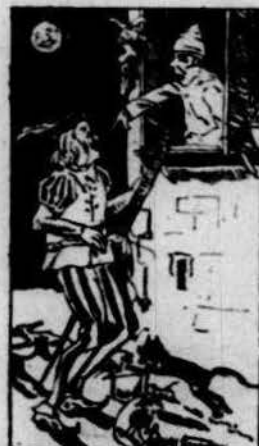
Y surt lo baró d'Espinach... y li aixafa la guitarra.