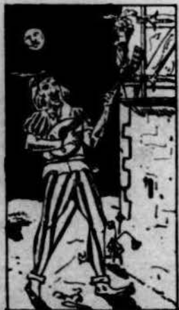
Arriba al peu de la finestra, y comensa à treure son talent.