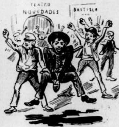
De ganas de tornarhi.