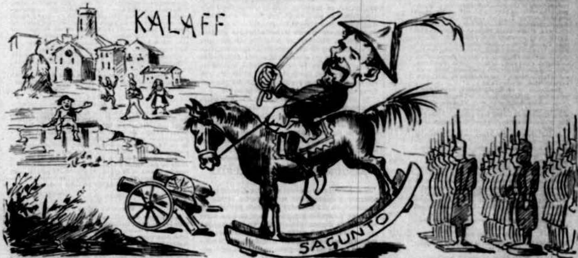
Del mercat de Calaf ben á la vora se prepara una guerra engrescadora.