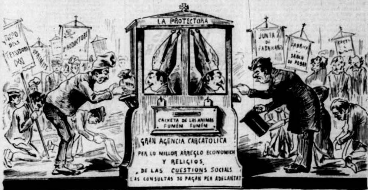
Per portarlos, ja camina tot un tren plé d' animals.

—Aqui un problema social pintém... —¿Fumém, D. Jaume! —¡¡Mientras tant, fumém!!