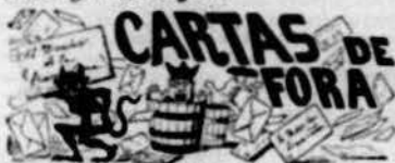
Collbató 3 Novembre 1900.

y lloch de sas doctrinas, sino si están ó no ben basadas en la justicia, tenim en compte que l' sentit natural de la justicia no pot ser altre que fer la conveniencia de tothom per igual, y may la d' uns per demunt de la desgracia d' altres. Deixem ara al temps que vagi lent sa eterna evolució cap al progrés ab lo pas de gegant que li marcs lo sigle del vapor y de la electricitat, que ja sabem que si las innovacions cap a la justicia haguessin de ferse per voluntat dels poderosos, encara estarían en la época terciaria en que 's mammutis eran los preponderants, sens més progrés que l' haver passat alguns d' ells a la categoria de burgesos.