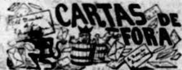
Molterans i de Fober de 1891.