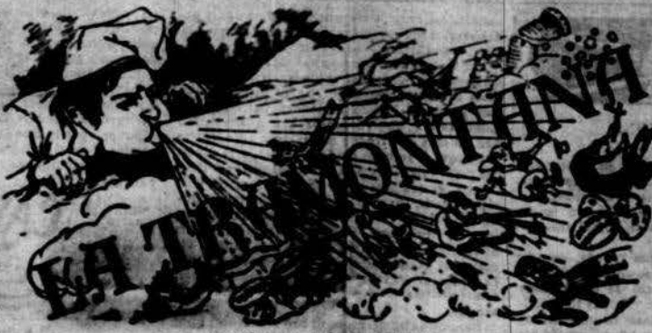
PERIÒDIC POLÍTIIC VERMELL

De més drets sense dèutes. De més dèutes sense drets. Los drets individuals son insprescripibles, inalienables i inarrendables. O Legislar la Llibertat beta pretext de garantia, en co- mots atestat contra ella. O La llibertat propiaca es all abont comença la llibertat ajena. Es lliç, donchs, al individu fer tot lo que no se perjudica a un altre. O La religió que professa les religions no es més que la fórmula del caputj ab que s'atribuixen la so- berania acahi en lo nom. O Les col·leccions son acahi d'absortir que d'edificat de la causa d'administració la nova, amagant pagar dretos d'arrastre al est.