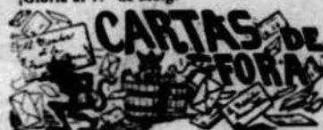
Punt d' Armentera 16 Mars de 1891

Amich Director: Lo que acaba de passar en aquest poble, llibra't per essencia, es una prova de lo que pot valer lo sufragi universal pera emancipar als treballadors.