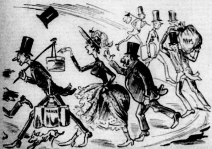
Y als burgesos més butxins la professó ls va per dins.