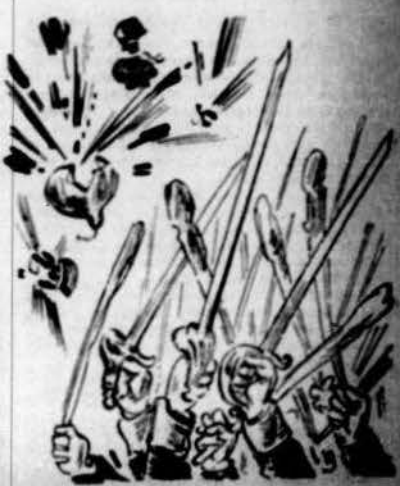
Y l' govern, per fi de festa, va repartint la ginesta.