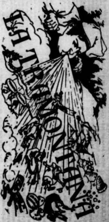
PERIODICH POLITICA VERMELL.

LA TRAMONTANA és una publicació política i social, que té per objectiu principal el desenvolupament de la lluita social i política. És una publicació que té per objectiu principal el desenvolupament de la lluita social i política. És una publicació que té per objectiu principal el desenvolupament de la lluita social i política.