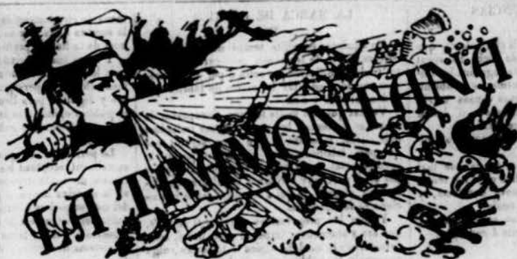
PERIÒDICH POLÍTICH VERMELL.

Si més béis comu béim. Si més béim comu béim. Les drets individuals son improscriptibles, sagrada- bles i inalienables. El Legislar la Libertat béis preu de garantir, en cas de necessitat, contra ella. La Libertat propiament dita és el dret de cada un de ajustar la seva vida, sense que ningú li pugui imposar un altre. La religió que predica la libertat no és més que la religió del saguntí, que's preu per tota la justícia social en la terra. Les religions son coses d'altres que vides de la terra, assegurant pagar cercans interessos al cel.