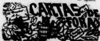
Vilafranca del Panadé 4 Setembre 1894

Molt senyor nostre: Moguts per la dolorosa impressió que va causaros un encertito, que vam tenir ahir a la tarde am dos missatges, no podém menos de dirgihli las següents mal girbudas ratillas.