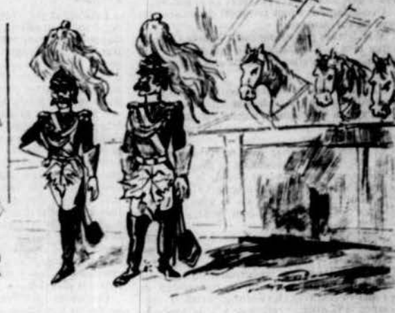
Mostra de la corassa que la societat La Fulla proposa á l'Ajuntament per adorno dels municipals de caball.