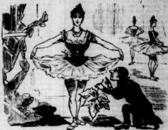
A las baylarinas també s'els colocarán fullas á las carnas pera que la moral no pateixi.