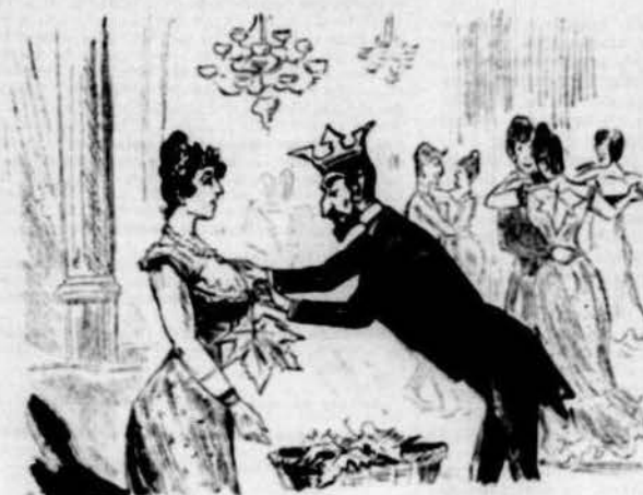
Un dels més honorables membres de La Fulla que va posant idems á las senyoras en els balls de l'aristocracia.