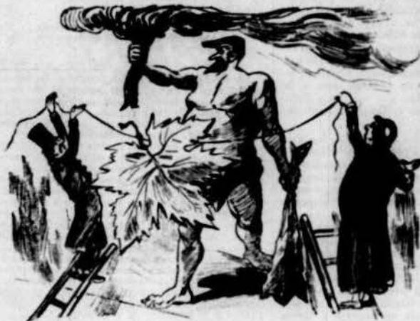
Colocació d'una monstruosa fulla devant de las carns del Hércules del Cap petit de can Güell.