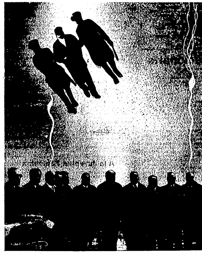
Crisis política. Los prohombres gubernamentales han jugado a las cuatro esquinas. Cambio de sitio y de comederio... Una figura "cumbre" de la República -- "max Casaj Piezas" -- preside el catarro; y el mismo programa e idénticos procedimientos... La República sigue su carrera hacia el fracaso total, nosotros ganamos... Se ha rendido un baluarte más: los folletos.