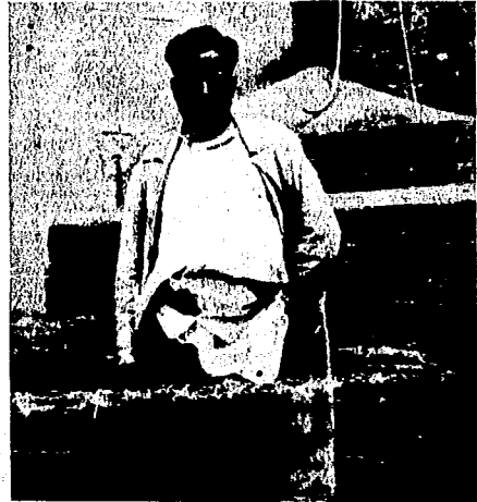
Una demostración gráfica de los últimos apaleamientos

Nosotros nos importa más la vida de estos miles de niños, de esos millones de seres sin comer, que la tragedia más o menos novelesca, de unos hombres, que en medio de todo nada les faltó nunca y que considero ni más ni menos, igual que los demás.