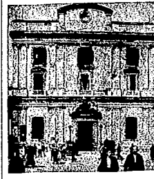
Un aspecto del local de los Somatens de Cataluña, después del bombardeo de las tropas.

Los acontecimientos de la última semana, para los que, como nosotros, hemos puesto como objetivo de nuestra vida la liberación económica, política y moral de los esclavos modernos, los trabajadores de las fábricas, los siervos del campo, los forzados de la mina, aportan un conjunto de tristes reflexiones. Todavía no han aprendido a distinguir los trabajadores cuáles son sus verdaderos intereses y cuáles son los intereses de su amo; todavía se dejan llevar por los especuladores y maces del poder del retablo. Con esa inconsciencia, mañana irá a la guerra cogidos por unas cuantas inyecciones de patriotismo nacionalista. Por menos se han prestado grandes masas estos días a las maniobras de astutos políticos que quieren a toda costa reconquistar el Poder, para seguir tirando desde allí al pueblo, como si hubiese una diferencia real entre ellos y los Lerroux o los Gil Robles.