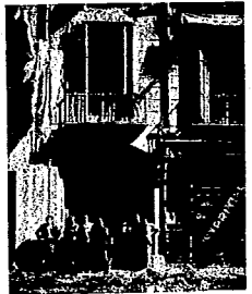
Una vista del Centro de Dependientes, hacia el que fueron disparados por las tropas los primeros cañonazos.

En Sabadell el foco más importante de la Alianza Obrera, el paro fué absoluto. En Sant Cugat de Vallés fué asaltado el Ayuntamiento por los comunistas, que resistieron largo rato el asedio. En Vil·lafraña del Panadés fueron incendiadas algunas iglesias. En Badalona, en Manresa, en Masnou, etc., fué secuestrado el movimiento. Abundaban las armas y había más de uno que ya se veía con un alto cargo en los respectivos ayuntamientos.