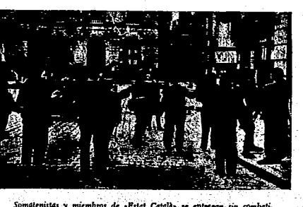
Somatenistas y miembros de «Euzkai» se entregan sin combatir

Eran dos fascismos los que luchaban por el predominio en el Estado. Ha triunfado el más fuerte. Así podíamos resumir la significación política de los últimos acontecimientos. Si nosotros hubiésemos intervenido, probablemente el resultado habría sido diverso. En lugar de triunfar el fascismo más fuerte, habría triunfado el más débil, y tendríamos que haber constatado que nuestra intervención no valió para otra cosa que para fortalecer al débil. Hay un camino todavía para vencer al fascismo, al fuerte y al débil, al de Madrid y al de Barcelona, y al de Vasconia, y al de todas partes: es la revolución social de los trabajadores y los campesinos españoles, la que enarbolará la C. N. T. y la F. A. I. Nosotros no rechazamos ningún apoyo para combatir al fascismo. Al contrario, toda nuestra propaganda tiende a conquistar reforzados. Pero por el verdadero camino: el de la supresión del Estado, el de la supresión del capitalismo, el de la organización de los productores para la gestión directa de todos sus asuntos, sin intervenciones parasitarias extrañas de ninguna especie.