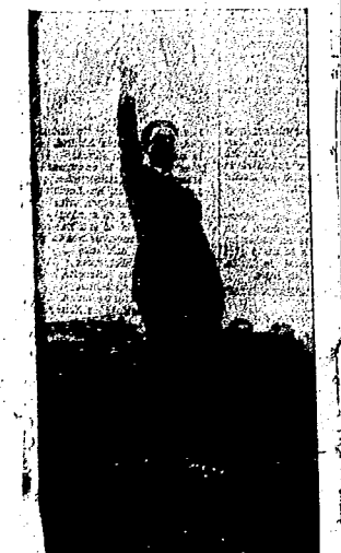
Durruti en Santa Cruz de Tenerife, de regreso de Bata, dirige la palabra al pueblo que lo aclama lleno de entusiasmo

TIERRA Y LIBERTAD, en este segundo aniversario de su muerte, rinde justo homenaje al hermano caído, como recuerdo a su vida de luchador infatigable por la causa de los oprimidos, así como a todos aquellos combatientes que aun luchan por la liberación del pueblo español y a cuantos encontraron una muerte gloriosa en esta lucha desigual que con tanto tesón y valentía sostiene el pueblo contra sus verdugos nacionales y extranjeros.